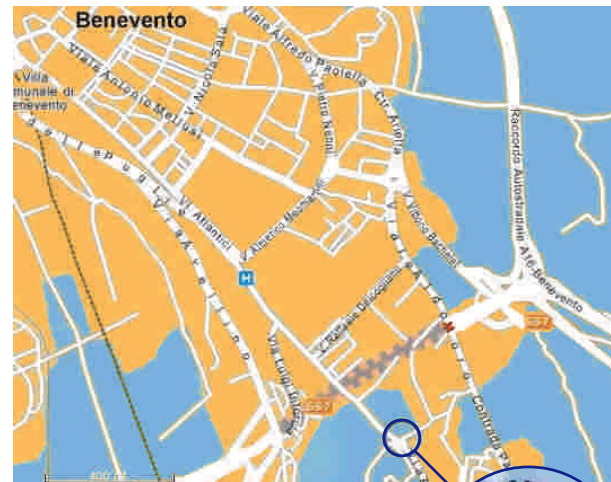
VILLA DEI PAPI

A tal fine, la SPO-Campania promuove la realizzazione di corsi di formazione, seminari, convegni ad elevato contenuto tecnico-scientifico grazie al coinvolgimento di docenti e professionisti con esperienza specifica nel settore.